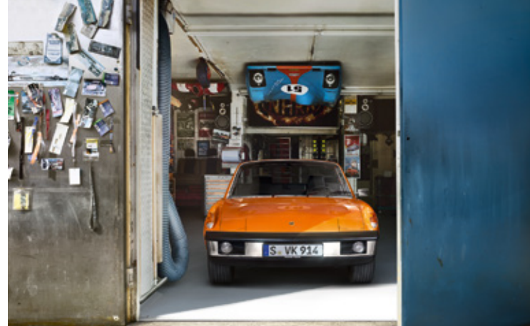
914 Années-modèles : 1970–1976, unités produites : 118 982, références disponibles : 1 700