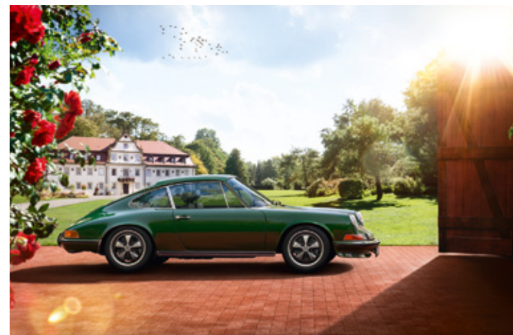
911 F Années-modèles : 1965–1973, unités produites : 81 100, références disponibles : 3 500