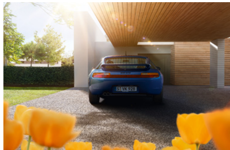
928 Années-modèles : 1978–1995, unités produites : 61 056, références disponibles : 8 500