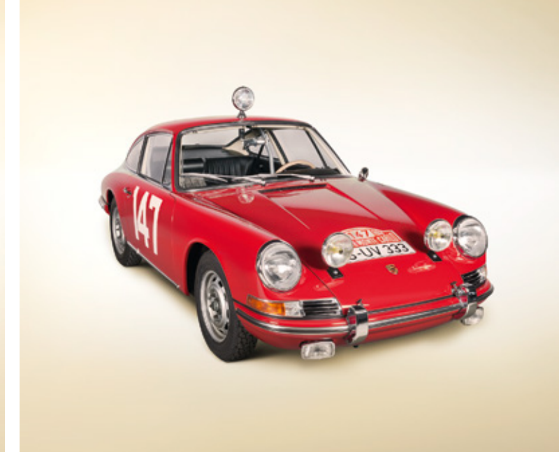
Photos avant / après : Porsche 901, Rallye Monte-Carlo, année-modèle 1965

Afin de répondre à ces exigences et d'être à même de proposer dans le monde entier la même qualité de service, nous avons développé un programme de formation dédié aux modèles Porsche Classic.