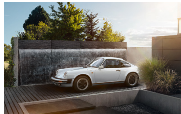
911 G Années-modèles : 1974–1989, unités produites : 196 397, références disponibles : 7 100