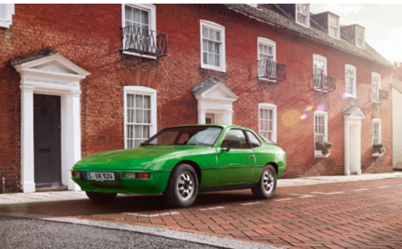
924 Années-modèles : 1976–1988, unités produites : 150 684, références disponibles : 4 200