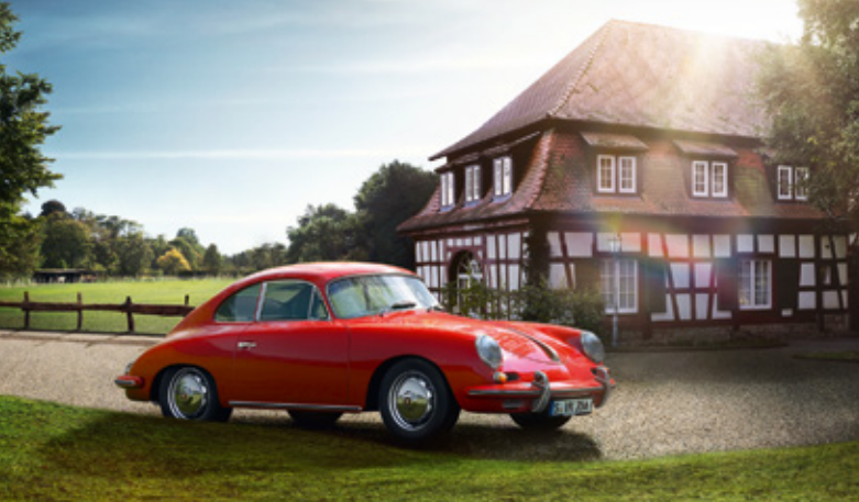
356 Années-modèles : 1950–1965, unités produites : 77 766, références disponibles : 2 100