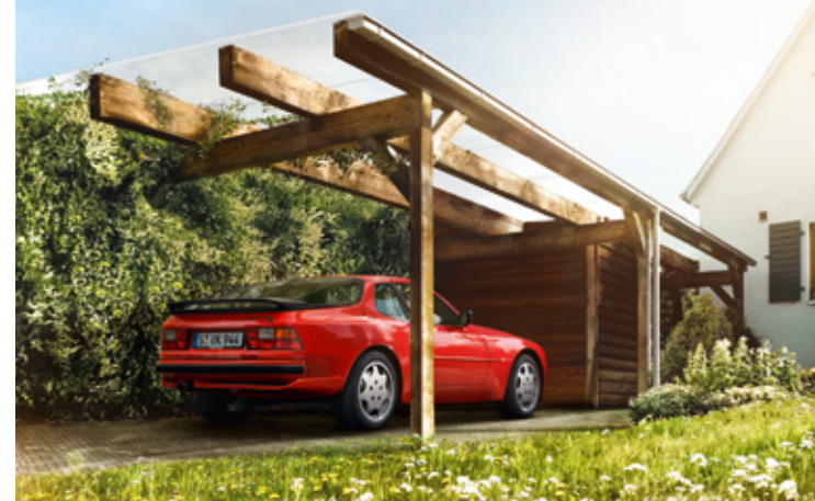
944 Années-modèles : 1982–1991, unités produites : 163 302, références disponibles : 6 200