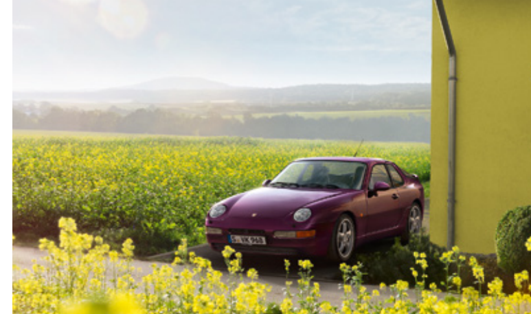
968 Années-modèles : 1992–1995, unités produites : 11 248, références disponibles : 5 900